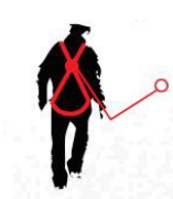
Fall FACTOR 1

anchor point located at the same level of the back anchor point of the harness