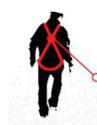
Fall FACTOR 2

anchor point located at the same level of the back anchor point of the harness