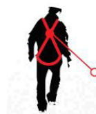
Queda FATOR 2 ponto de ancoragem situado a baixo da conexão dorsal do arnês